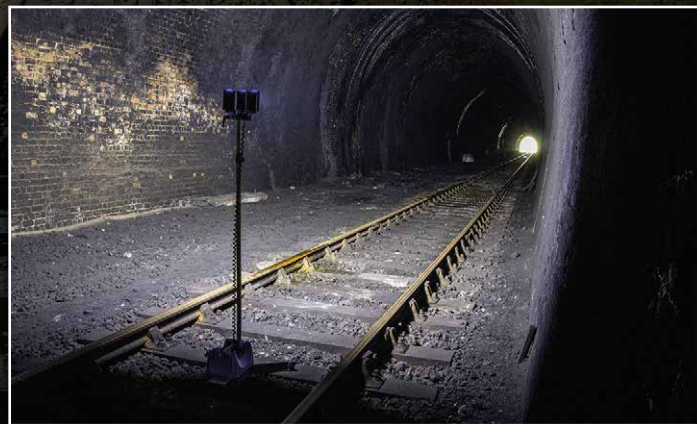
Iluminación focal direccional de 180°