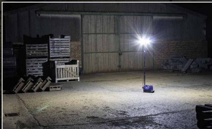
Iluminación focal del área de 360°